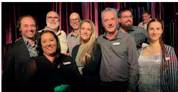
La gang du Patro!